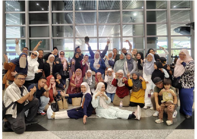
與團隊成員參與 BE Leadership Meeting