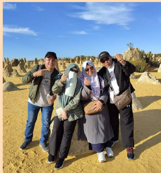
與家人一起參與 BELT 旅遊獎勵之旅

她十分重視導師制度、持續學習以及嚴格遵守公司規範，並認為這些都是實現長期且可持續成功的重要基石。