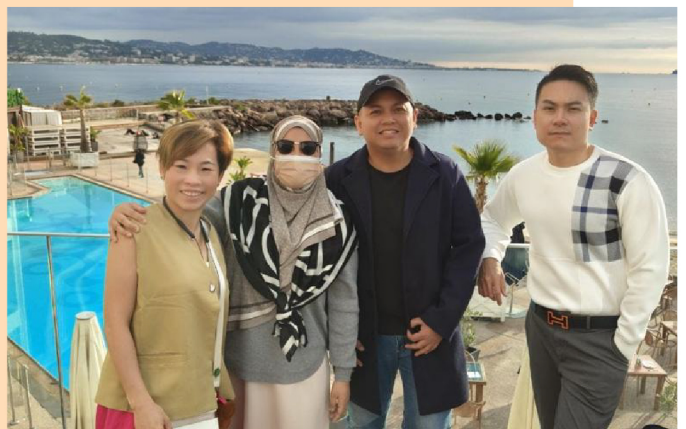
與導師一同前往米蘭參加 BEST 獎勵之旅