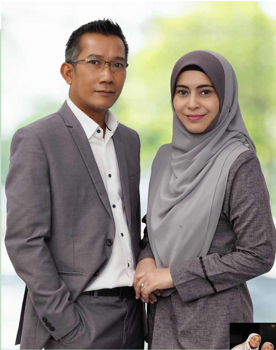
與公司創辦人合照