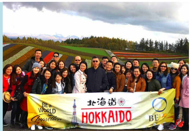
BE Lifestyle Travel 到日本

燕微最後說道：「記得，最好的投資就是健康。當你投資在自己和家人的健康上時，你已經踏上通往夢想生活的成功大道了。」